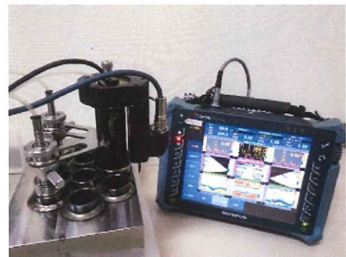
図2 探傷器・ジグ外観