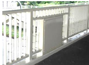
歩道橋用（高欄設置型）