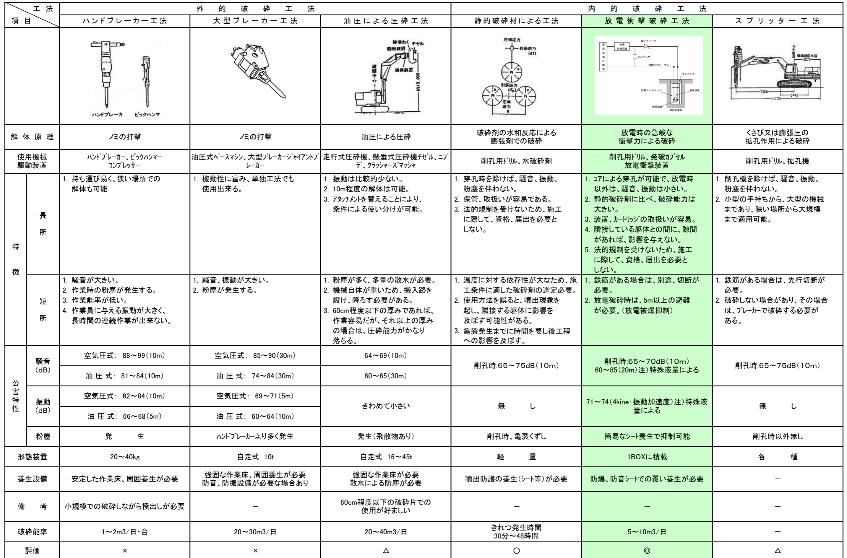
各種破砕解体工法比較表