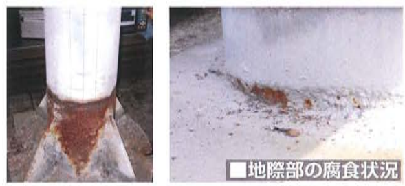
■地際部の腐食状況