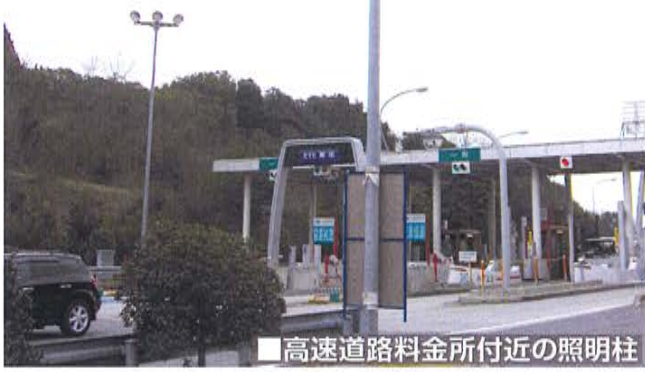
■高速道路料金所付近の照明柱

道路付属設備の一つである照明柱は、地際部に雨水などが溜まりやすく、経年によって地際から埋設部にかけて腐食が発生し、断面欠損を生じることがわかっています。弊社では、既存の技術である埋設部分の腐食・減肉状況を定性的に判断できる金属柱劣化判定システムを照明柱(軽量鋼管柱)に対応するべく改良開発に取り組んできました。