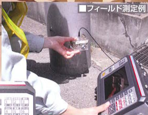
探触子とホルダー