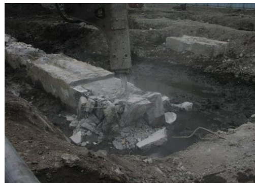
5 鉄筋ガス切断・破碎部整形