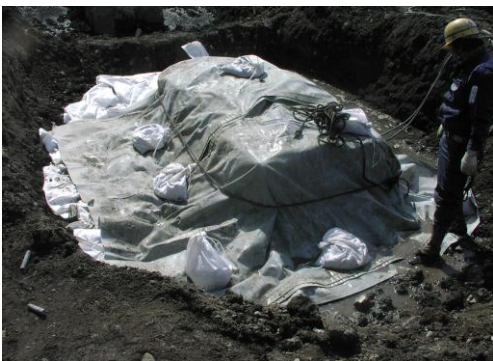
3 防音・防爆シート設置