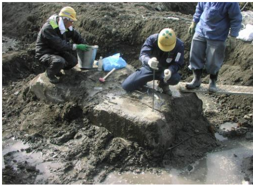
2 カートリッジ装填