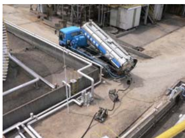
ローリーによる残油移送