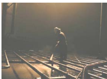
タンク清掃(ジェット洗浄)