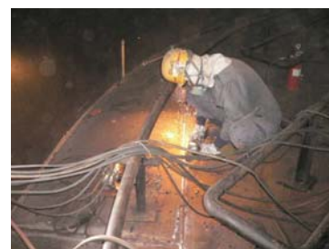
改修工事(グラインダー仕上げ)