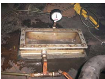
非破壊検査(真空検査)